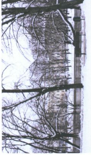
Foto 13 ja 14: Vaated planeeringualale Kaarsillalt ning Ülejõe pargist.

Kontaktvööndis on nii ühe- kui kahe-suunalisi tänavaid ja suuremaid jalakäijate alasid: Raekoja plats, Kүүni tänav. Jalakäijate peamised liikumissuunad on toodud Planeeringuala kontaktvööndi funktsionaalsete ja linnaehituslike seoste kaardil (vt kaart nr 3).