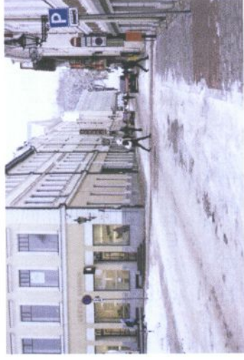
Foto 11 ja 12: Vaated kontaktvööndis paiknevatele Munga ja Kүүtri tn-le.

Planeeritavast alast ida suunda jääb Emajõgi, mis on elupaigaks III kategooria kaitsealusele liigile (laiujurile - Dytiscus latissimus ).