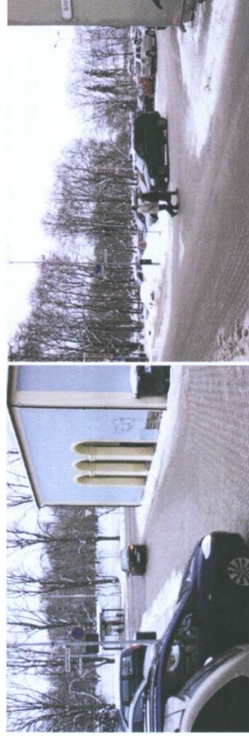
Foto 9 ja 10: Vaated Magistri tn juurdepääsudele Vabaduse pst-lt ja Gildi tn-lt.

Planeeringuala on otseselt seotud viie tänavaga, millest kaks (Magistri ja Gildi tn) läbivad planeeringuala. Maa-alal paiknevate hooneteni on võimalik mootorsõidukiga pääseda Magistri, Kompanii ja Gildi tänavatelt.