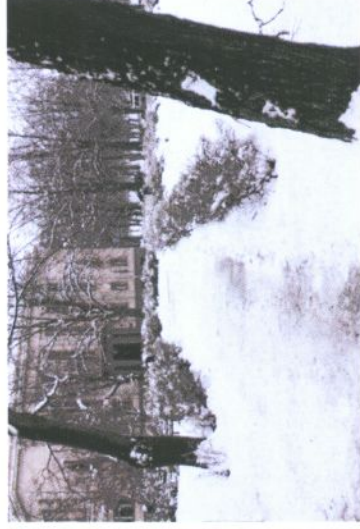
Foto 3 ja 4: Vaated Politseipargile Munga ja Kompanii ning Gildi ja Kompanii tänavate nurgalt

Kompanii ja Magistri tänavate vahelisel alal asuvad olemasolevad Tartu Oskar Lutsu nimelise Linnaraamatukogu ja Tartu Kunstimuuseumi 3- ja 4-korruselised hooned. Hoonete fassaadid moodustavad piki Magistri tänavat ühtse tänavafrondi, raamatukogu ja muuseumi peasissepääsud jäävad Kompanii tänavale. Olemasolevad jalakäijate juurdepääsud hoonetele on toodud Olemasoleva olukorra kaardil (vt kaart nr 2).